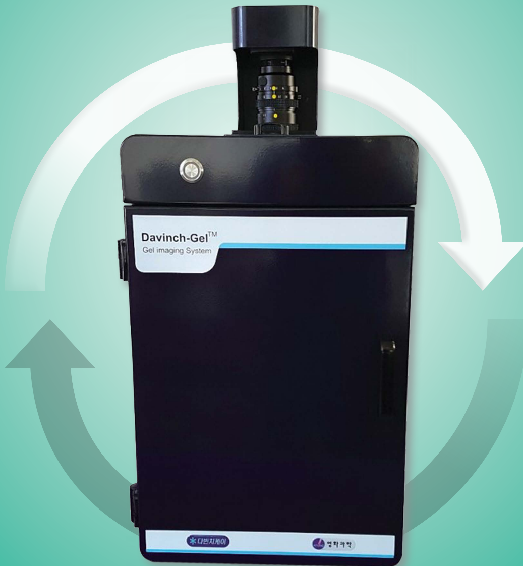
Davinch-Gel™ Imaging System